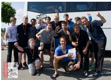
U16 OTB Jugend