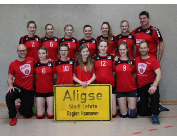
Landesmeister U20 weiblich SF Aligse