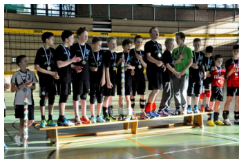
Landesmeister U14 männlich Oldenburger TB