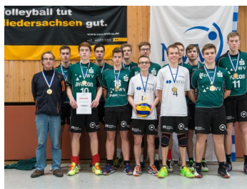
Landesmeister U20 männlich TSV Giesen

Hier einige Landesmeister des Jahres 2015