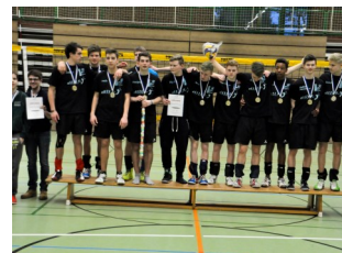
Landesmeister U18 männlich Oldenburger TB