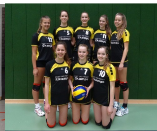
Landesmeister U16 SC Union Emlichheim