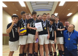
Landesmeister U16 männlich VSG Hannover